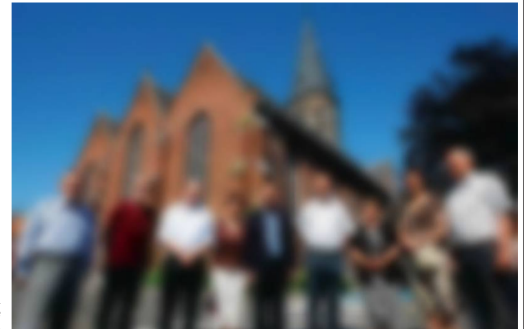
De werkgroep van het Open Kerkenproject voor de dorpskerk van Assenede. 'We willen iedereen de kans geven de prachtige architectuur en inrichting te ontdekken.'

Of dat ook een invloed zal hebben op het bezoekersaantal